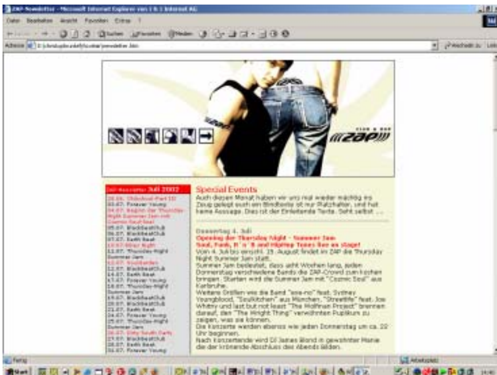
Und ein fertiger Newsletter – hier mit Kalendermodul – Beispiel Zap-Club Stuttgart

Das System erfordert einen Webserver mit PHP-Modul mit aktivierter Mail-Funktion sowie eine MySQL-Datenbank. Sofern sie keinen eigenen Server betreiben ist dieses Funktionspaket bei einem günstigen und zuverlässigen Provider schon ab ca. EUR 5,00 / Monat verfügbar.